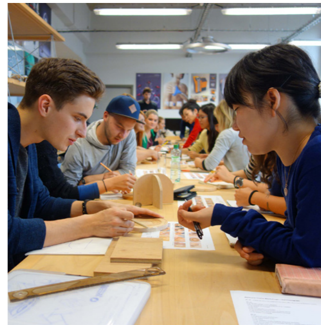
海外の教育機関と連携して実施する「国際交流プロジェクト」。(チェコのトマスバタ大学との工芸交流プロジェクト)

美大にもともとある国際的な環境が グローバル人材育成における強みに 多様な資質の学生を受け入れ、さらに発展を。